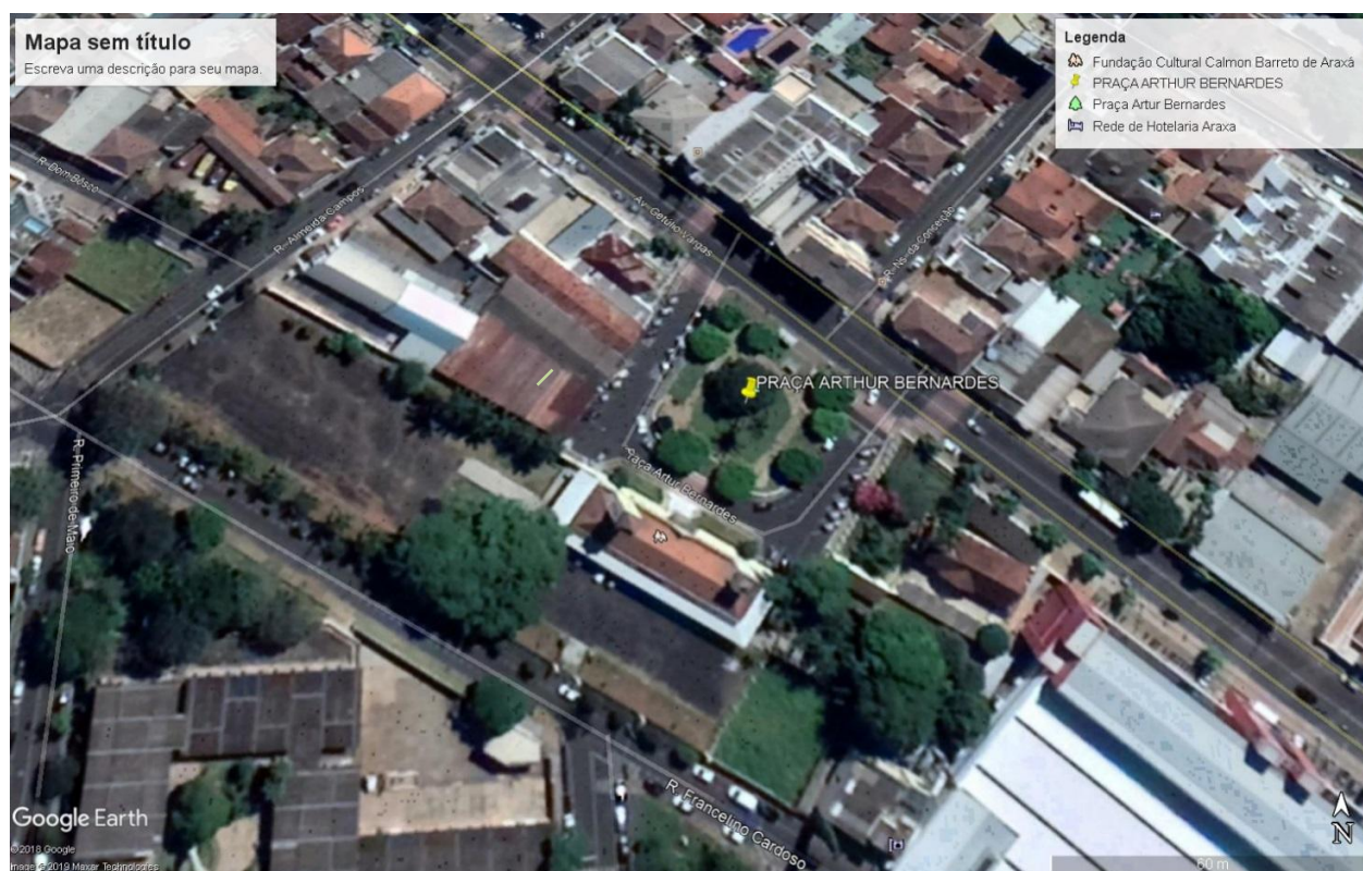
Imagem de Satélite - Localização da obra de Reforma e Revitalização da Praça Arthur Bernardes - Praça Arthur Bernardes, s/n - Bairro Centro - ARAXÁ/MG.

NOME DO PROJETO: OBRA DE REFORMA E REVITALIZAÇÃO DA PRAÇA ARTHUR BERNARDES ENDEREÇO: PRAÇA ARTHUR BERNARDES, S/N - BAIRRO CENTRO - ARAXÁ/MG - CEP: 38.183-218 ÁREA DO TERRENO: 1.300,00 m 2 Nº DE PAVIMENTOS: 01(UM)